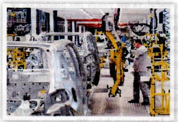
► En la ciudad brasileña de San Pablo, se localiza la primera planta automotriz de Toyota fuera de Japón. Actualmente, posee plantas de ensamble en doce países alrededor del mundo.

El ejemplo más claro de este sistema lo representa la fabricación de automóviles, en la que cada componente es fabricado en un lugar y luego se ensambla en otro distinto. A esta dinámica se la conoce como dispersión territorial de la producción.